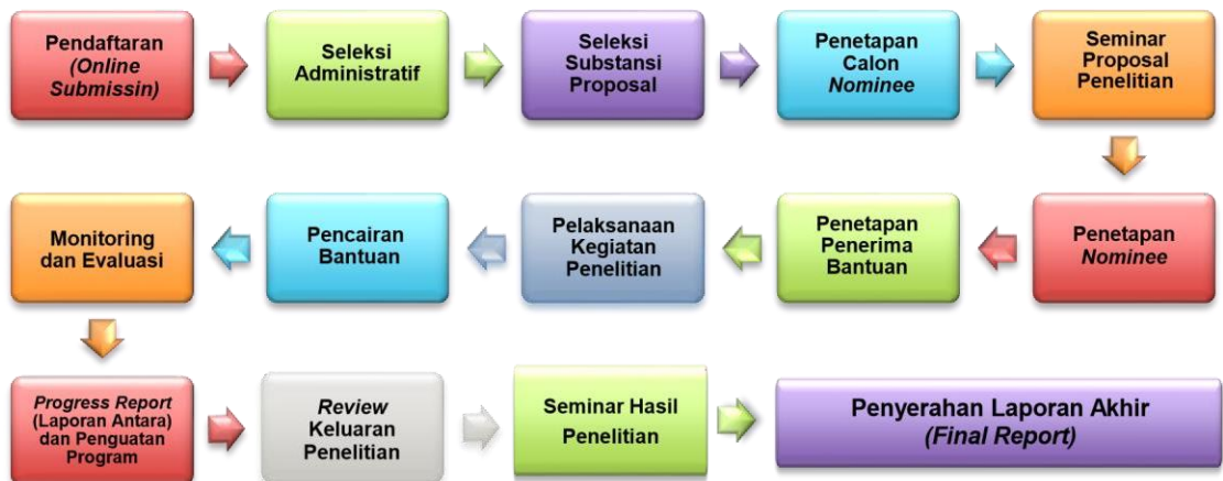
Gambar Alur (Proses) Pengelolaan Bantuan Penelitian Berbasis Standar Biaya Keluaran

Tahapan dan penjelasan masing-masing proses bantuan penelitian berbasis standar biaya keluaran ini, dapat dilihat pada gambar di bawah ini.